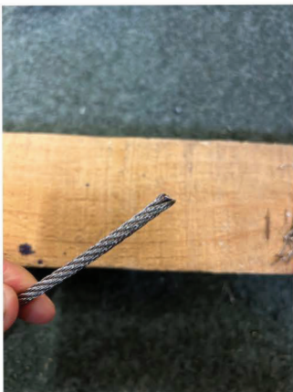
Slipa tills det inte sticker ut någon vajer åt sidan