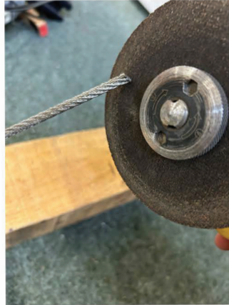
Slipa till toppen på vajern