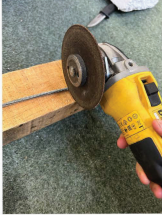
Kapa vajern med rondellkap.